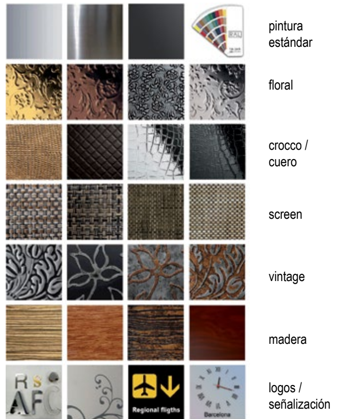
Ejemplos de frontales personalizados según diseño del cliente